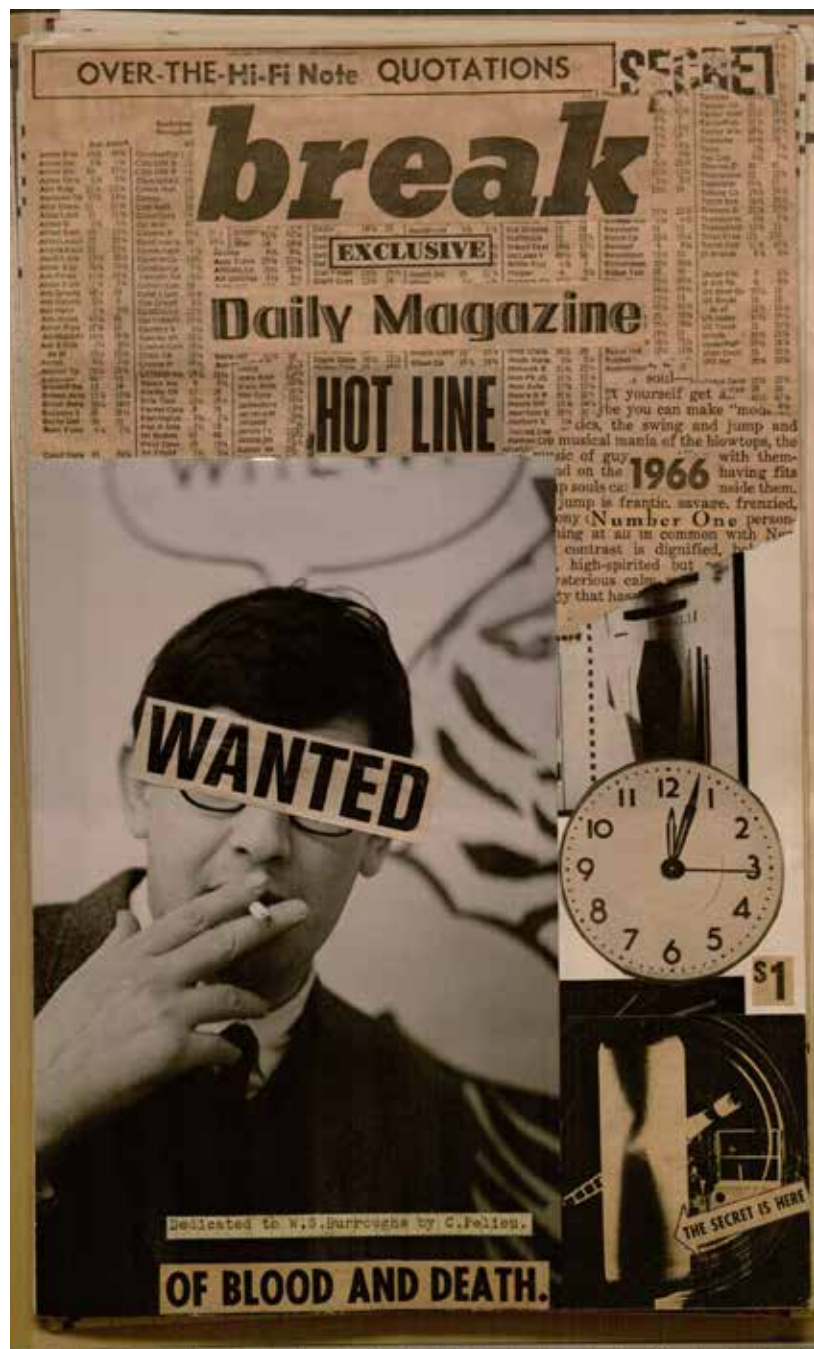
'Break' collages, 1966, University of Kansas.

Treize, 24 rue Moret, 75011. Métro Couronnes.